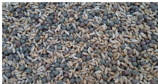
300 grains de triticale + 40 grains d'arkta/m 2