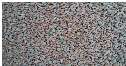
300 grains de triticale + 20 grains d'ascension