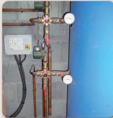
Départ des 2 réseaux de chaleurs