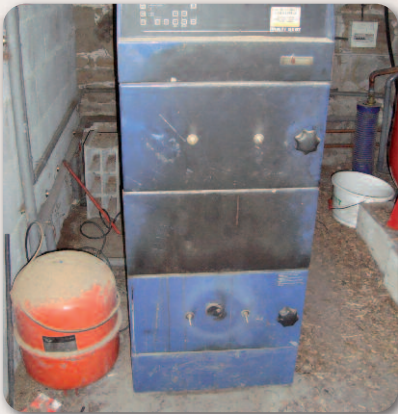
Chaudière avec vase d'expansion (en rouge)